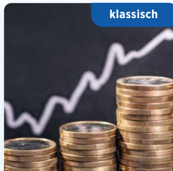
Fonds-Rente bAV Invest